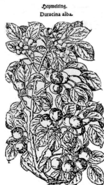
Älteste Abbildung des „Heimeldinger“ (n. Tabernaemontanus 1588/91)

Stielgrube tief, mitunter braune, strichartig-konzentrische Berostung oder strahliger, grünlicher Rostflecks; Stiel kurz, 8-