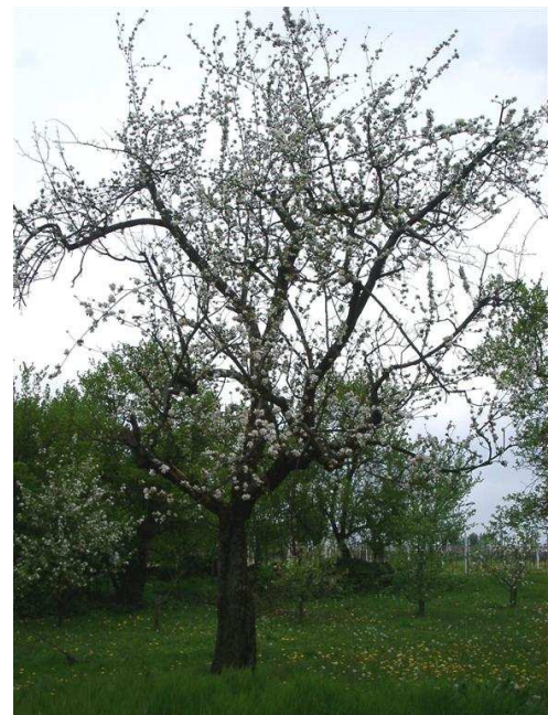
„Heimeldinger“ in der Gemarkung Impflingen/SÜW

Die Sorte war wie zahlreiche andere traditionellen Lokal- und Regionalsorten seit 1919 bei der damaligen Obst- und Weinbauschule Neustadt an der Haardt (der späteren SLFA Neustadt an der Weinstraße, seit Sept. 2003 „Dienstleistungszentrum Ländlicher Raum Rheinpfalz“) im Versuchsanbau. Ende der 1930er Jahre gibt es den letzten Literaturhinweis: Mit vielen anderen Sorten des Versuchsanbaus wurde auch der „Heimeldinger“ als für die damaligen obstbaulichen und ernährungspolitischen Ansprüche untauglich bewertet. Seitdem fehlen jegliche Literaturhinweise auf Anbauversuche und Vorkommen.